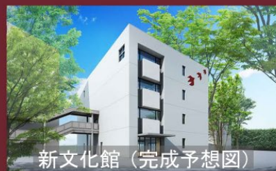
新文化館（完成予想図）

雲雀丘学園は「親孝行」と 「やってみなはれ精神」を大切にして 子どもたちを育てています